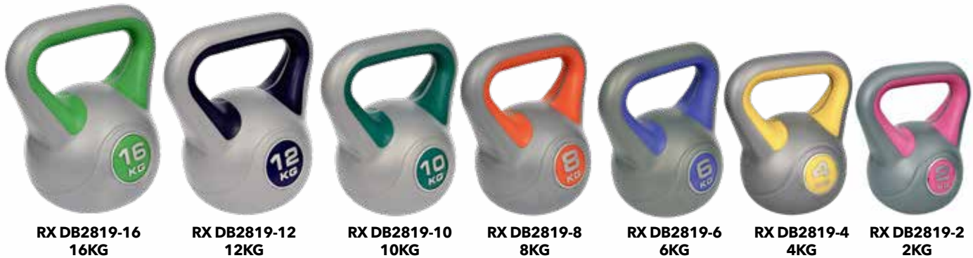
RX DB2819-16 16KG