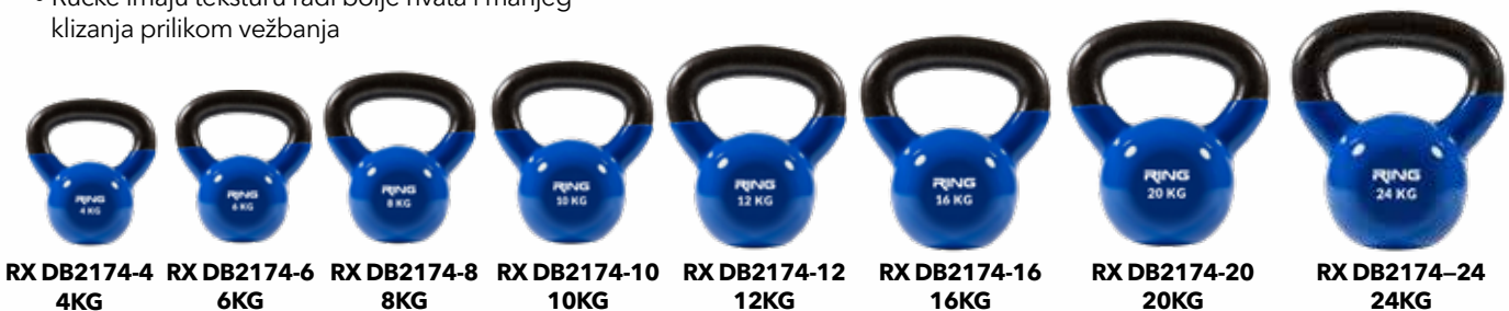
RX DB2174-4 4KG