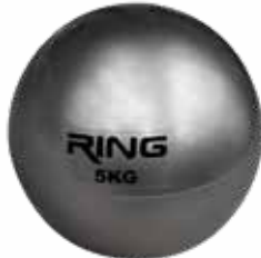
RX BALL009 5KG