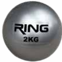
RX BALL009 2KG