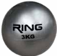
RX BALL009 3KG