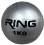
RX BALL009 1KG