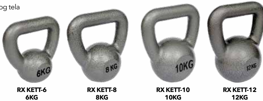
RX KETT-6 6KG